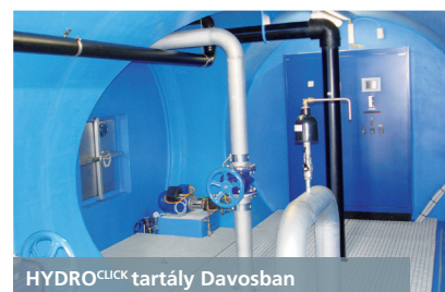
HYDROCLICK tartály Davosban

A HYDROCLICK rendszer egyaránt biztosít gyors, és biztonságos technológiát új betonszerkezetek, illetve felújítások alkalmával már meglévő betonfelületek esetében (például víztároló tartályoknál) is.