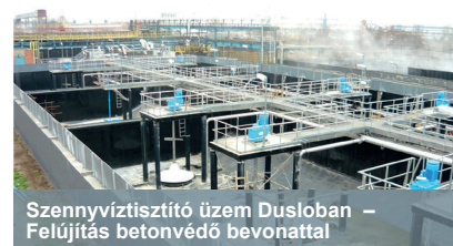
Szennyvíztisztító üzem Dusloban – Felújítás betonvédő bevonattal